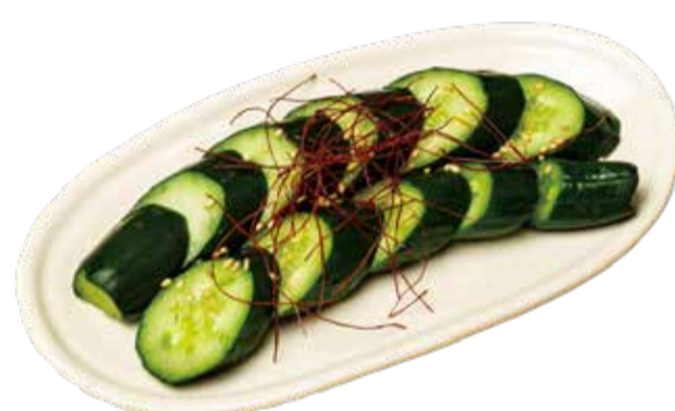
浅漬けきゅうり 二九〇+税