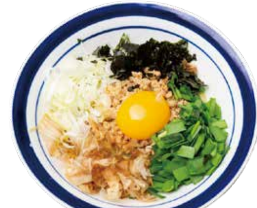
台湾まぜそば 四九〇+税