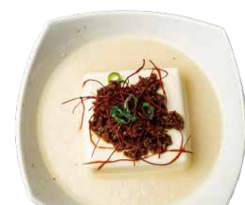
冷やし麻婆豆腐 二九〇+税