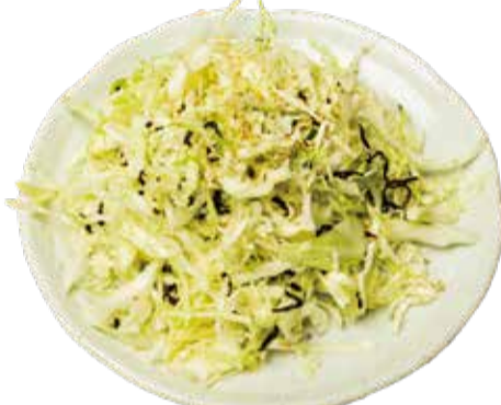
塩昆布キャベツ 一九〇+税