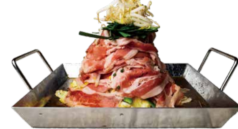
王道しょうゆ 一二九〇+税