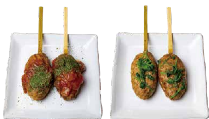
サルサ 三九〇+税 パクチー 三九〇+税