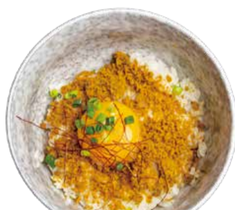
うばそぼろ TKG 三九〇+税