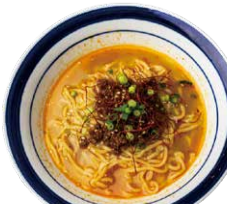
シメの3口担々麺 三九〇+税