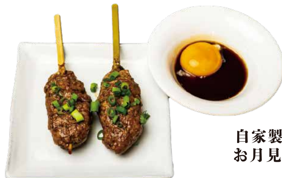
自家製豚つくね お月見 三九〇+税

山椒やタンコツを練りこんだ自家製の豚つくね オーダー毎に生から焼き上げジューシーふっくら 備長炭で焼きあげています