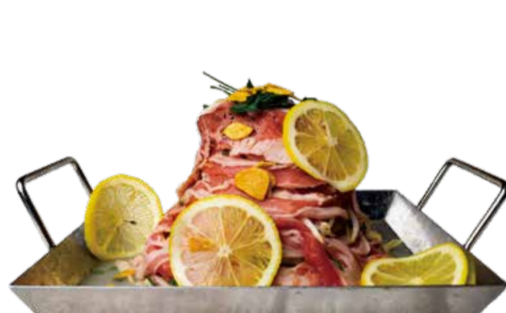
塩ダレれもん 一二九〇+税