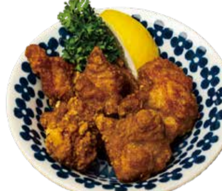
若鶏唐揚げ 三九〇+税