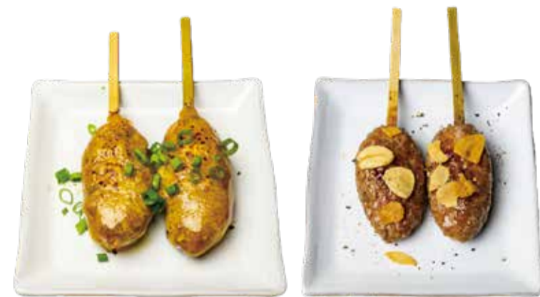
チーズ 三九〇+税 ガーリック 三九〇+税