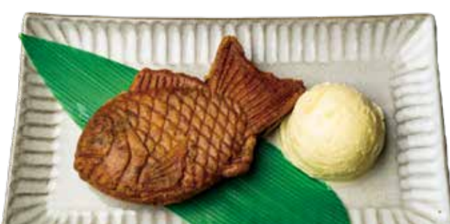
揚げたたいやきくん 三九〇+税