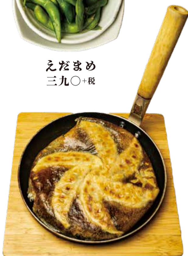
羽根つきジャンボ餃子 六個 四九〇+税