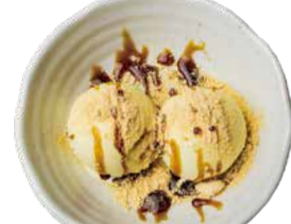
黒蜜きな粉パニラ 三九〇+税