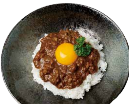
特製キーマカレー 五九〇+税