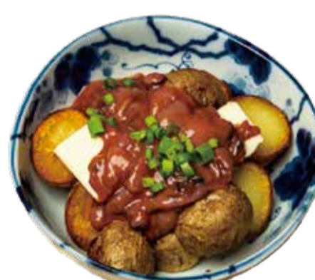
塩辛バターポテト 三九〇+税