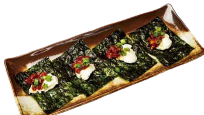
チャンジャチーズ 四九〇+税