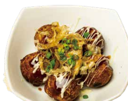
揚げたこ焼き 三九〇+税