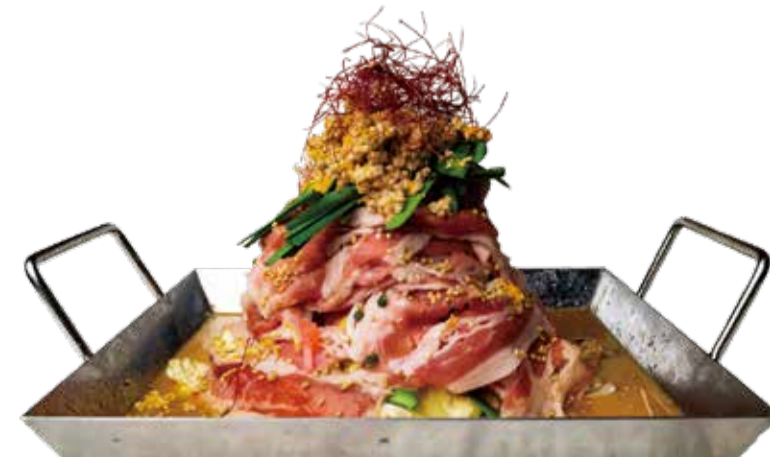
胡麻ごま坦々 一二九〇+税