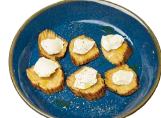
いぶりがっちょチーズ 三九〇+税