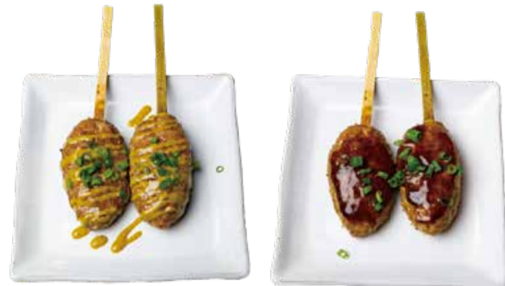
カレー 三九〇+税 BBQ 三九〇+税