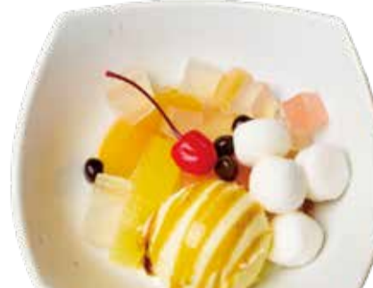
白玉みつまめパフェ 三九〇+税