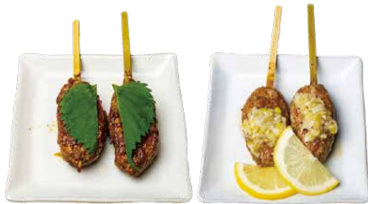
梅しそ 三九〇+税 ネギれもん 三九〇+税