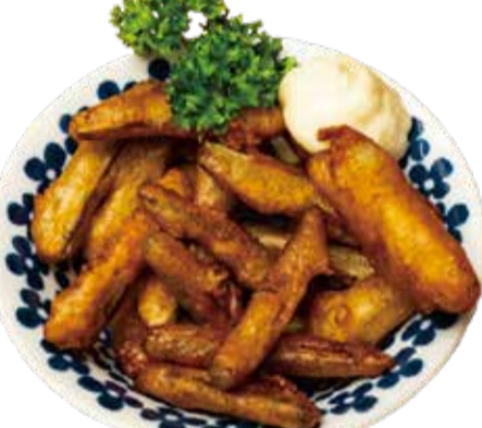
ごぼう揚げ 三九〇+税