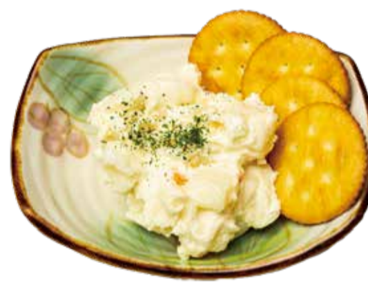
ポテリッツ 三九〇+税