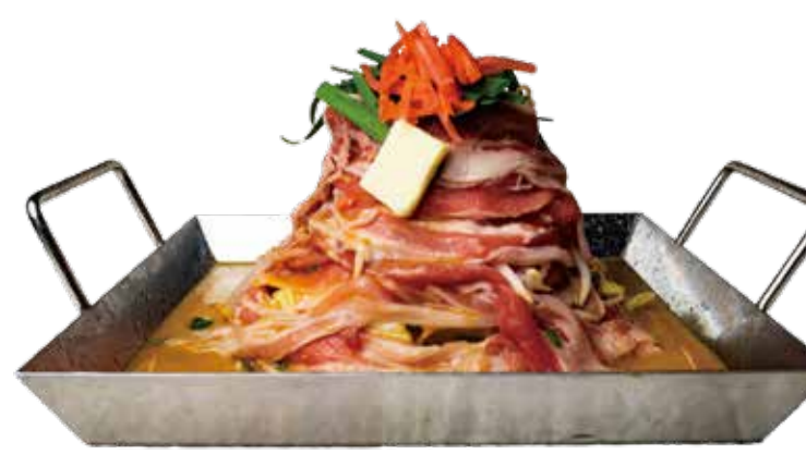
紅生姜みそバター 一二九〇+税